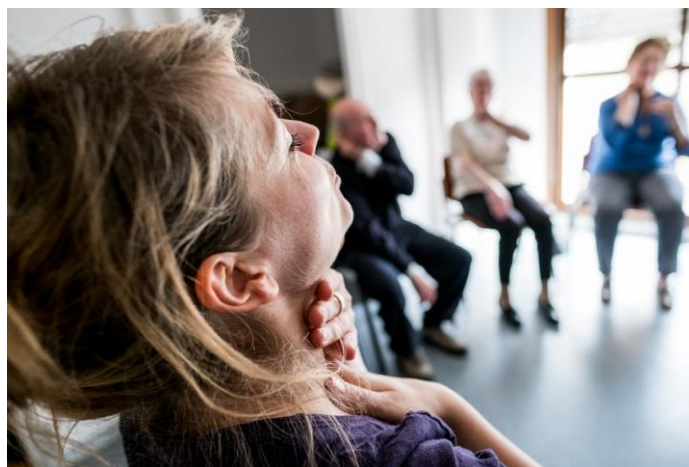
Résidence de Recherche en EHPAD